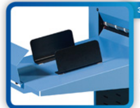
Uscita Delivery table