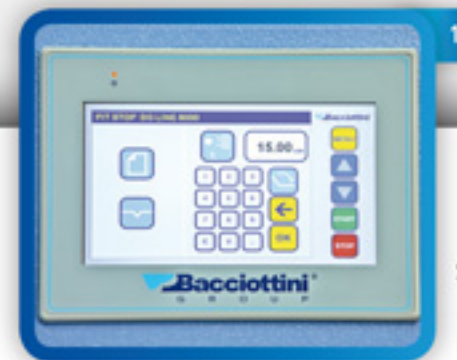
Schermo touch screen 7" Touch screen 7"